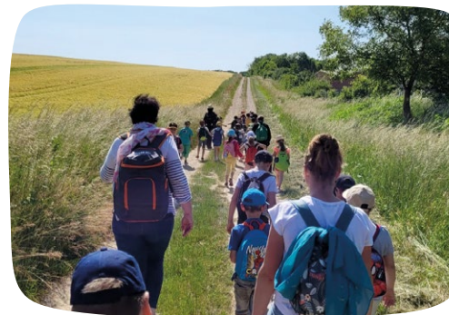
Balade contée sur la Via Francigena