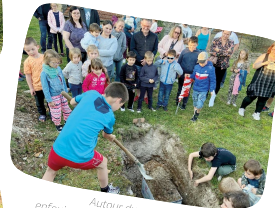
Autour du monde : enfouissement de la capsule temporelle