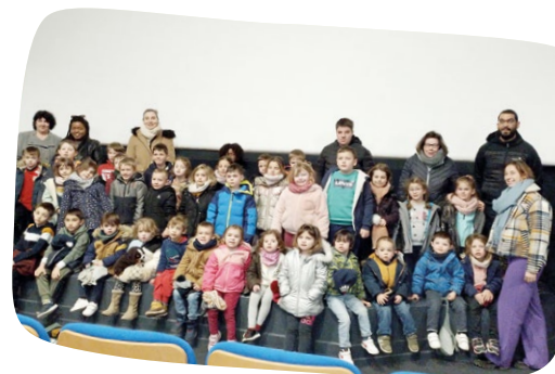
Silence ça tourne !