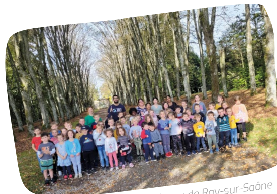
Explor Games® au château de Ray-sur-Saône