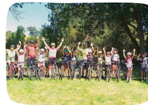
Savoir rouler à vélo